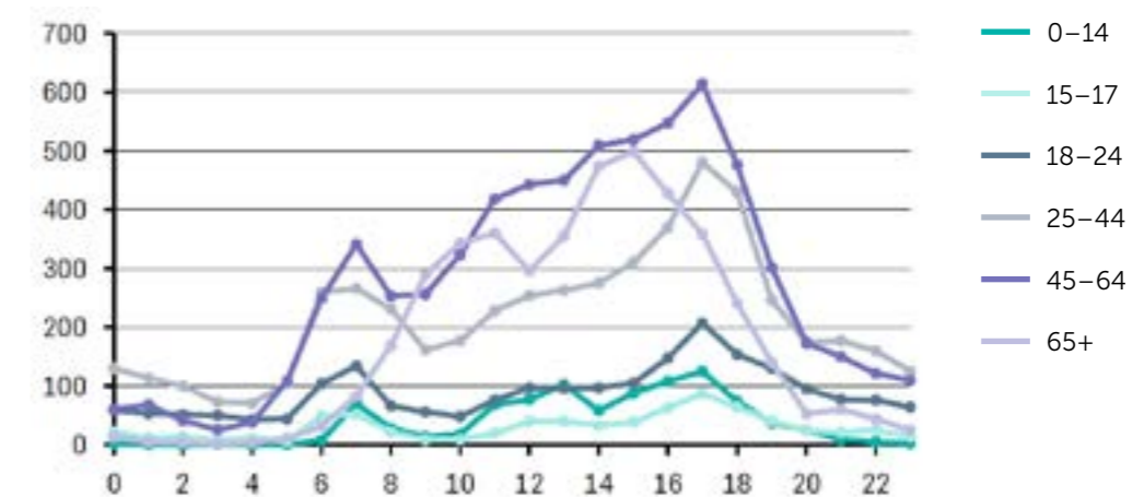
Tableau 1-3: © bpa, Rapport SINUS 2021, p. 26

Victimes de dommages corporels graves selon l'âge et l'heure, Σ 2016-2020.